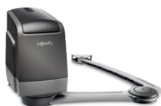
AXOVIA® 3S+ io