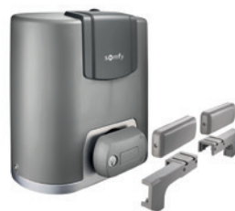
ELIXO® 3S+ M io